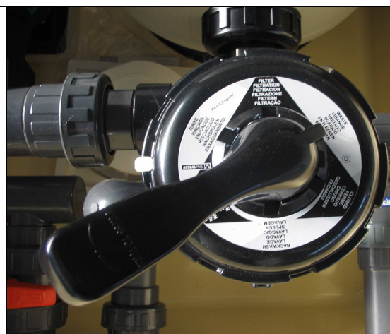
LLAVE 6 VÍAS